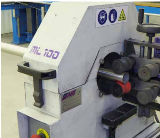
Fertiges Rohr kommt aus der Rohrschleifmaschine.