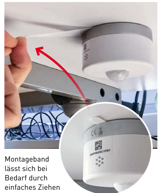
Montageband lässt sich bei Bedarf durch einfaches Ziehen leicht entfernen.