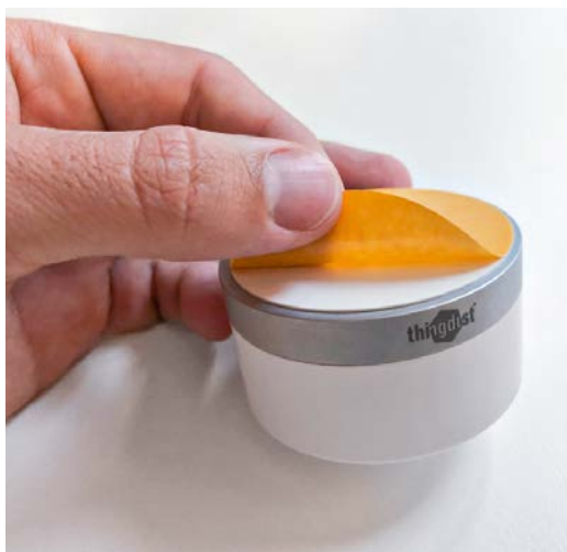
Schutzfolie wird an der Anfasslasche vom Montageband abgezogen, um den Sensor an der Decke oder unter dem Pult anzukleben.