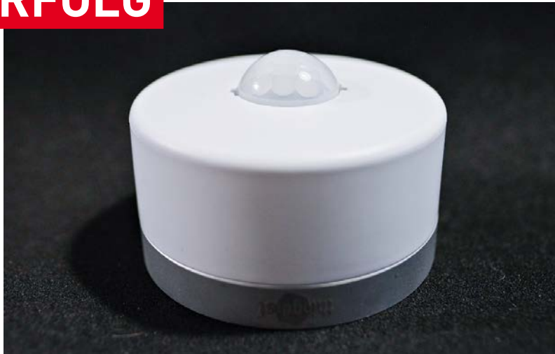
Smarter Multisensor wird unter Arbeitstischen oder an der Decke von Meeting-Räumen montiert.