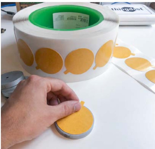
Multisensor wird mit IBZ-Formstanzteil aus doppelseitigem wiederablösbarem Montageklebeband ausgerüstet.