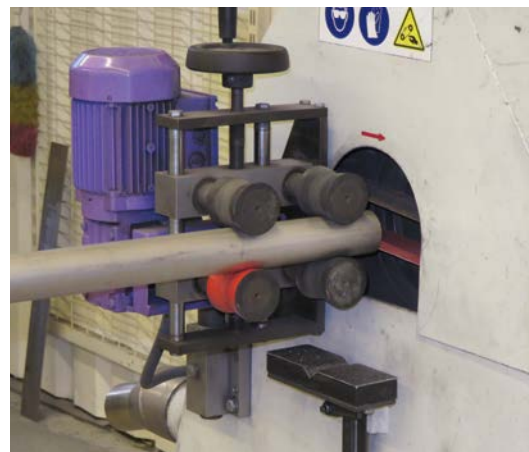
Les tubes sont polis avec un abrasif IBZ/Longo.

EBAG Edelstahltechnik AG à Alpnach Dorf est spécialisé dans le traitement de l'acier inoxydable. Grâce à cette société, vous pouvez vous détendre dans l'espace bien-être du nouvel hôtel de charme Valsana Hotel & appartements à Arosa avec entre autres des lits à bulles.