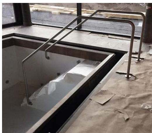
Accès sécurisé de la piscine, relaxation.