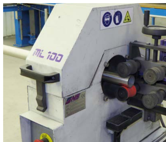
Tube prêt sortant de la ponceuse à tube.