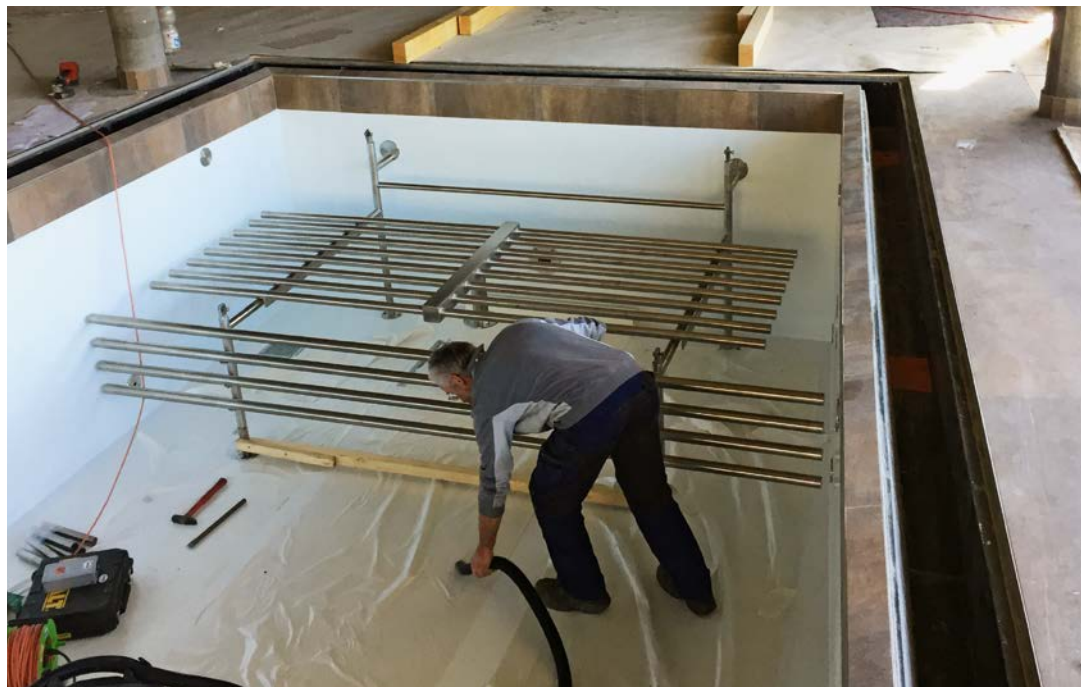
Des tubes en acier inoxydable cintrés et des lits à bulles sont montés.